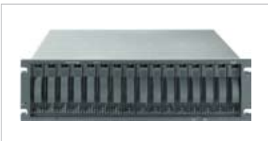
Abb.: IBM System Storage DS4700