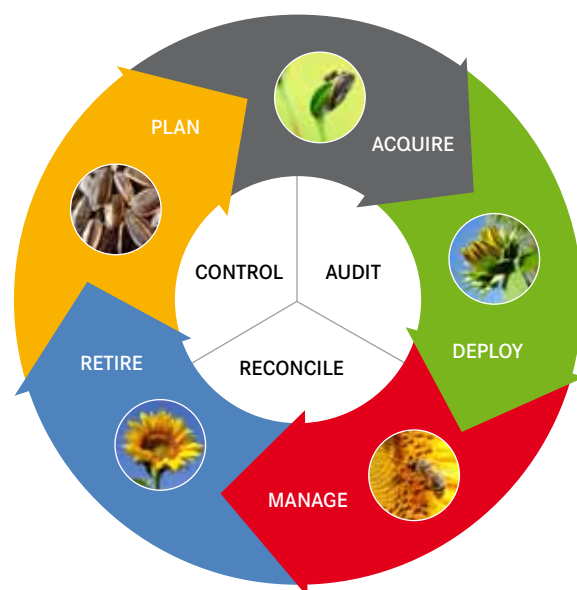
Abbildung: Service und Asset Management Kreislauf